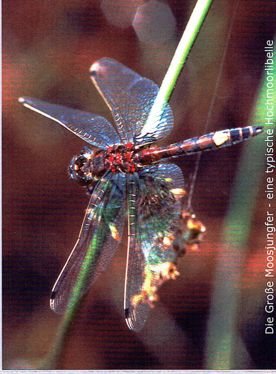
Die Große Moosjungfer - eine typische Hochmoorlibelle